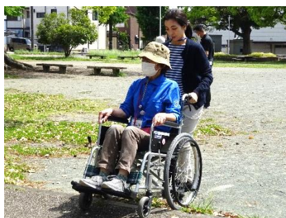
肢体不自由者ガイドヘルプ ボランティア講習会(5/9)