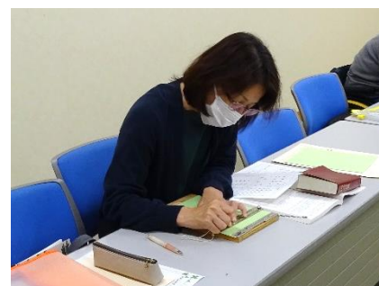
点訳ボランティア養成講座 (昼の部 5/20~・夜の部 5/24~)

☆ボランティア養成講座の詳細については、ホームページや講座紹介冊子(裏面)をご覧ください。