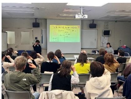
手話入門基礎講習会(4/15~)